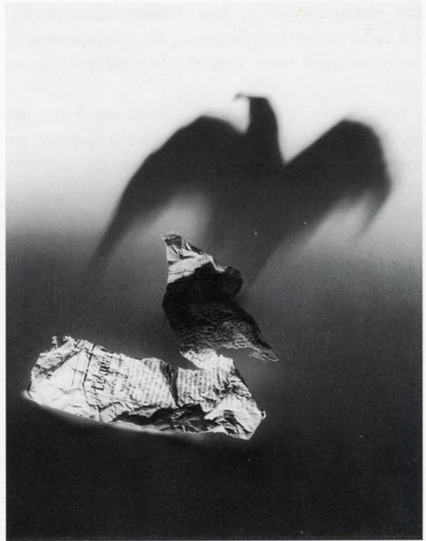
Le quart état, 1997 Photo noir et blanc contrecollée sur aluminium 115 x 85 cm