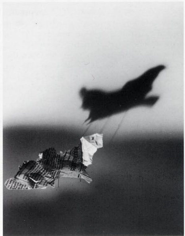
Dégraissages, 1997 Photo noir et blanc contrecollée sur aluminium 115 x 85 cm